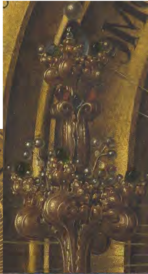
30 e 31. Particolari