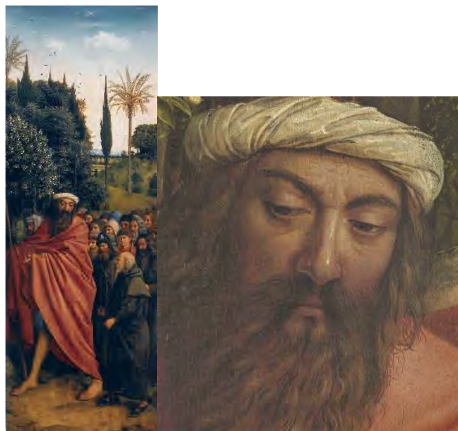
72. I pellegrini – 73. San Cristoforo

L'ultimo pannello in basso rappresenta i pellegrini (fig. 72). All'epoca dei Van Eyck, senza aerei e viaggi organizzati, il pellegrinaggio era un'avventura lunga e pericolosa. Talora ci si lasciava la vita. Ma ci si conquistavano anche grandi meriti, quei meriti silenziosi che costruivano ogni giorno il Regno. C'era bisogno di affidarsi alla Provvidenza: ecco allora la guida del gigante san Cristoforo (fig. 73), che un giorno guidò a traversare un fiume lo stesso Re dei Re, Gesù.