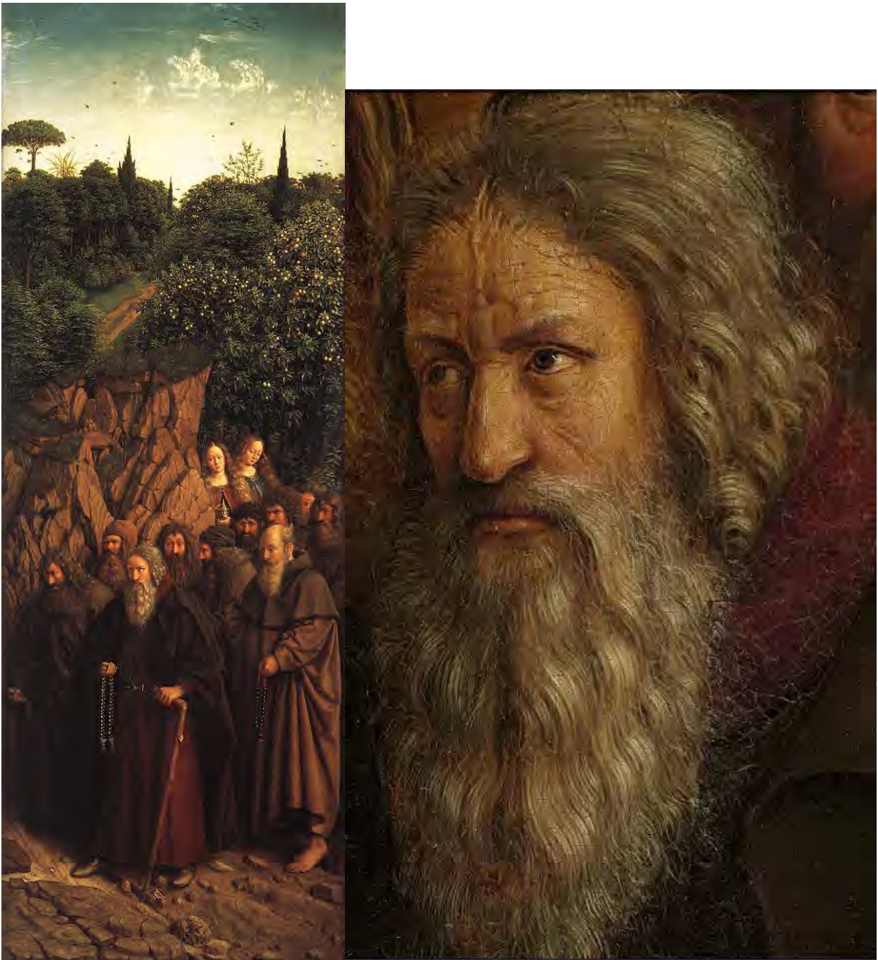
69. Gli eremiti – 70. Sant'Antonio Abate