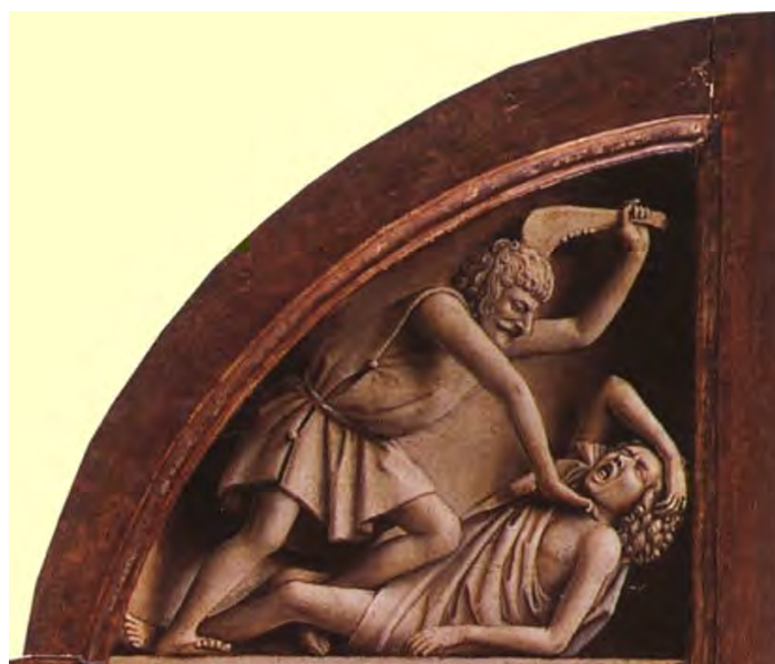
27. Caino uccide Abele

Così, dall'altra parte del polittico, il dramma si consuma. Caino uccide Abele (fig. 27). Il regno del male e del disordine sembra trionfare.