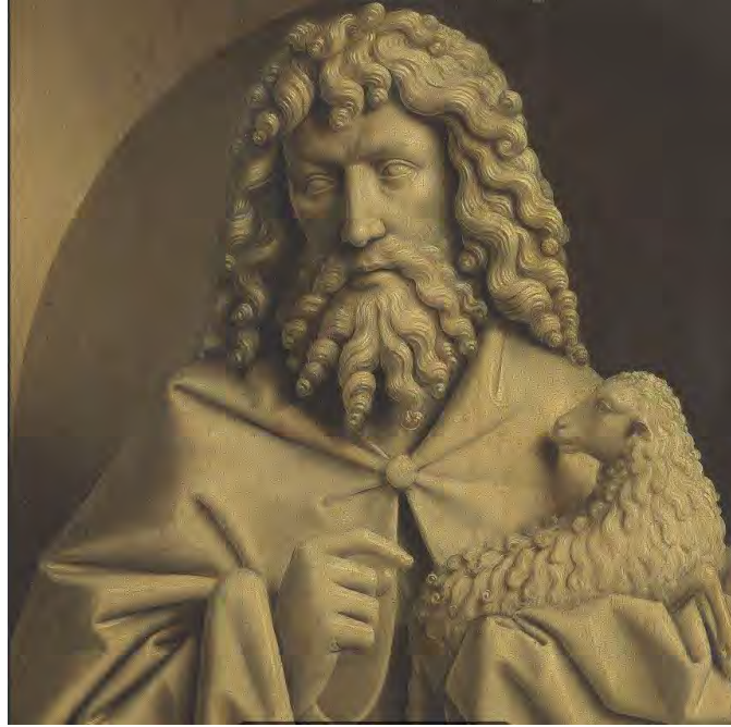
5. San Giovanni Battista