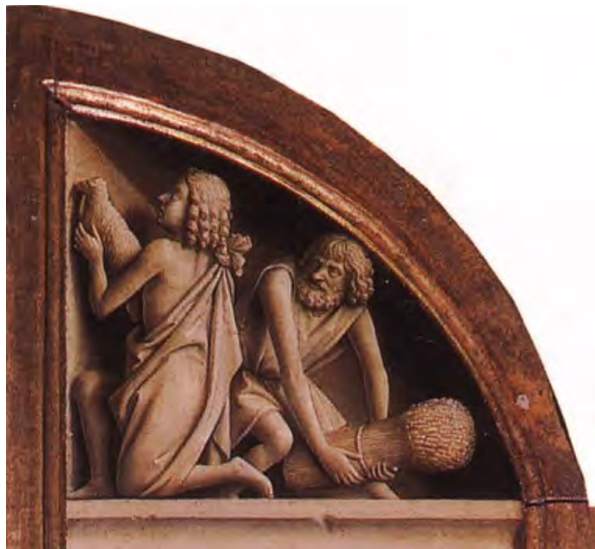
26. Abele e Caino

Che il disordine sia molto reale lo scopriamo nella storia di Caino e Abele (fig. 26). Nell'offerta dell'agnello di Abele c'è già un preannuncio del Regno eucaristico dell'Agnello: ma l'invidia di Caino ci ricorda che la strada verso il Regno è ancora lunga.