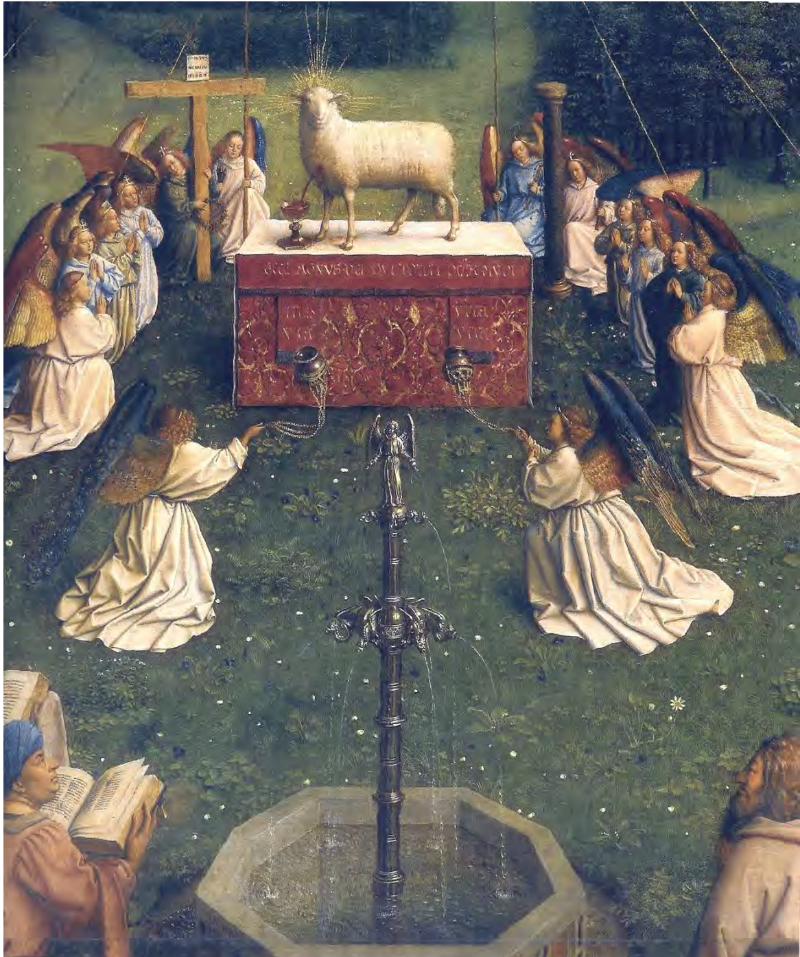
40. L'altare dell'Agnello

Eccoci finalmente al pannello più splendido e famoso (fig. 39), dove il Regno di Gesù Cristo sui cuori e sulle nazioni si precisa come Regno eucaristico. Al centro di tutto, com'è giusto che sia, sta l'Agnello, sull'altare della Messa circondato dagli angeli (fig. 40).