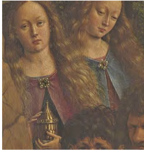
71. Santa Maria Maddalena e Santa Maria Egiziaca

Sono uomini e donne: in fondo si scorgono santa Maria Maddalena, con l'unguento con cui unse i piedi di Gesù – divenuta secondo la tradizione penitente ed eremita negli ultimi anni della vita, e santa Maria Egiziaca (ca. 344-421), un'altra donna dissoluta che espì i suoi peccati con una vita eremitica esemplare (fig. 71).