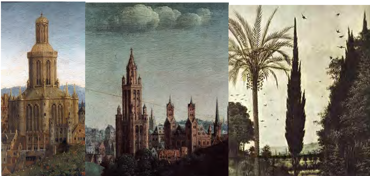
59, 60 e 61. Particolari

È la Terra com'è – e il Regno è davvero sociale –, con le sue chiese (fig. 59), le sue città (fig. 60), le sue campagne – dovunque nel mondo, come indica una vegetazione fantastica dove convivono alberi del Sud e del Nord (fig. 61).