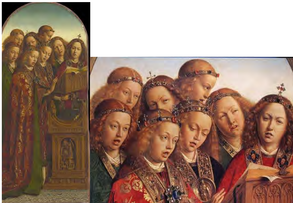
35. Gli angeli cantori – 36. Particolare