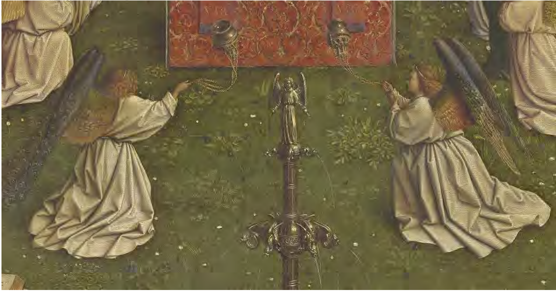
44. Gli angeli incensatori

La gloria del Regno dell'Eucarestia domanda la celebrazione e la lode, simboleggiata dall'incenso (fig. 44).