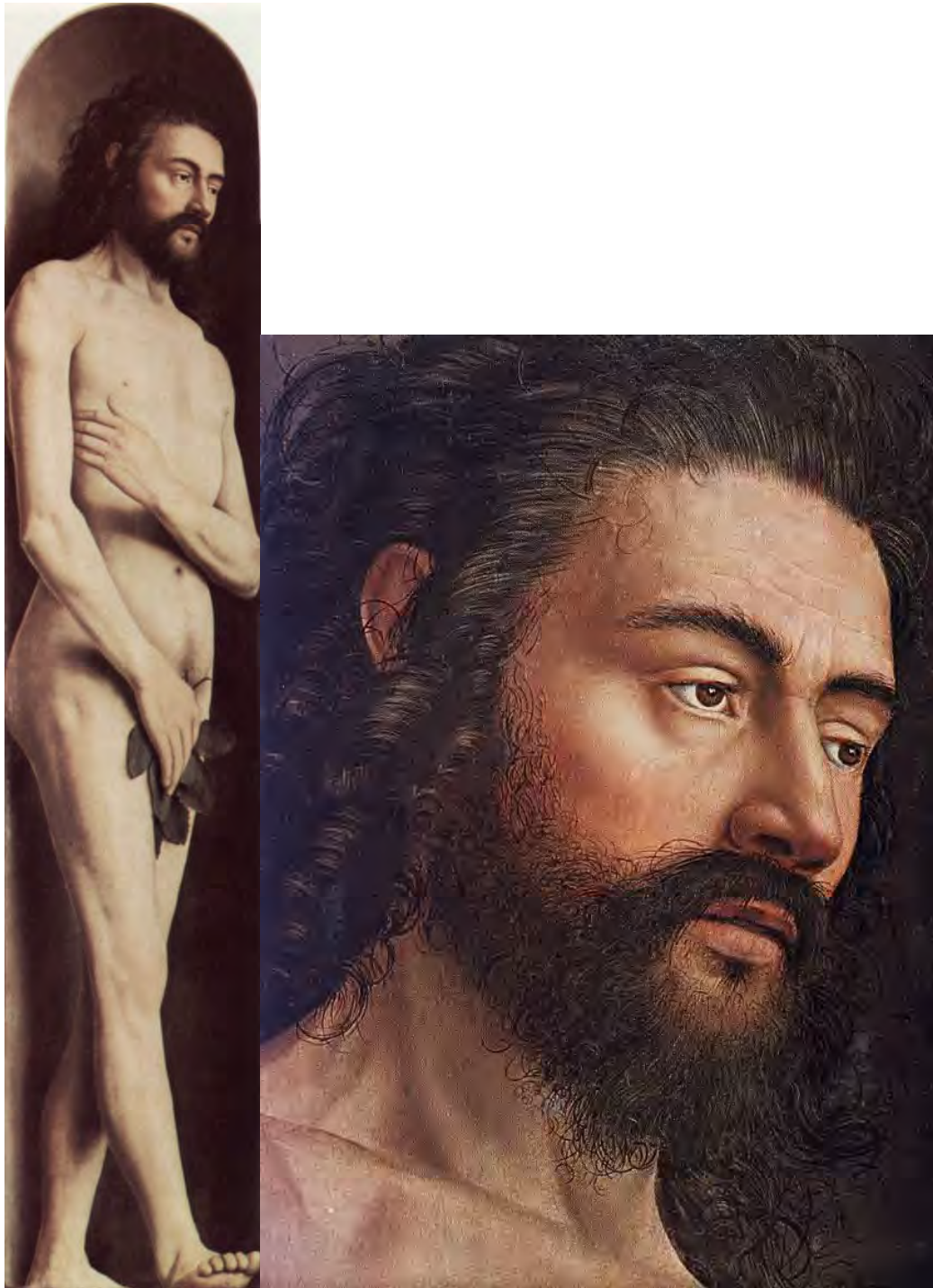
21. Adamo – 22. Particolare

politico, mostra l'improvvisa consapevolezza del disordine che è entrato nel mondo e l'attesa di un regno che restauri l'ordine.