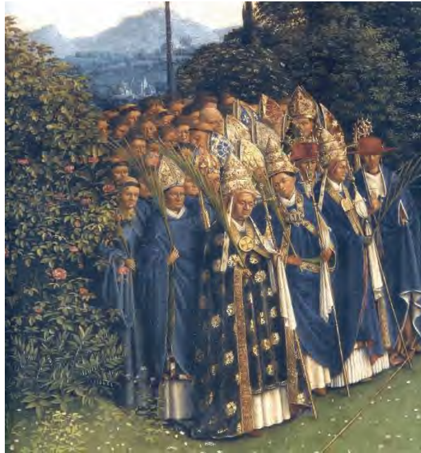
55. I santi

In secondo piano convergono verso l'Agnello coloro che annunciano il Regno, i santi e le sante di Dio. A sinistra i santi (fig. 55): si sono contati tre Papi, due cardinali e undici vescovi, più preti, religiosi e laici.