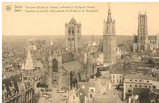
1. Gand e la Cattedrale di San Bavone

Il polittico di Gand, custodito nella Cattedrale di San Bavone (fig. 1), si compone di ventisei pannelli. Chiuso, consta di dodici pannelli. Aperto, ne rivela altri quattordici.