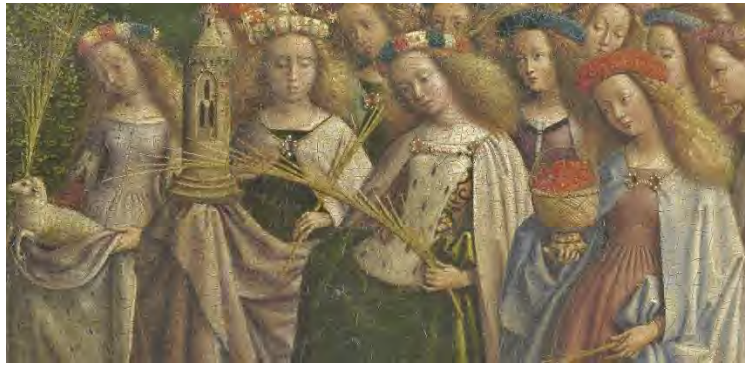
57. Le sante: particolare

Dietro ai santi e alle sante, emerge una parte del pannello di cui sbaglieremmo a trascurare l'importanza: i raggi dello Spirito Santo trasfigurano la Terra e la trasformano, propriamente, nel Regno (fig. 58).