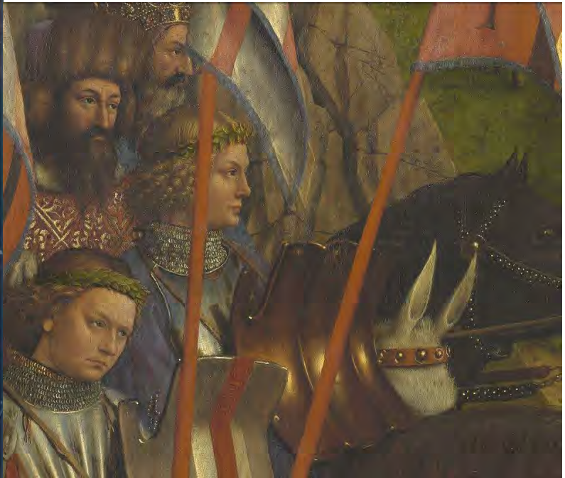
64. I cavalieri di Cristo – 65. Goffredo di Buglione