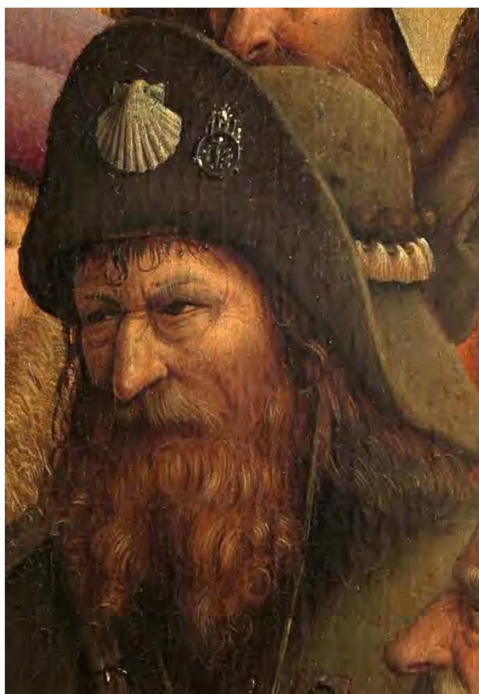
74. Un pellegrino

Ma a noi interessa il pellegrino comune (fig. 74): con il volto segnato dalle difficoltà della vita, quest'uomo è stato a Santiago de Compostela (la conchiglia) e in Palestina (la medaglia sul berretto). Sulla giubba s'intravede il volto di Cristo: il segno che è stato anche a Roma. Ma è un uomo che fa fatica, e si vede. Fa parte – come ha detto Papa Francesco nella sua omelia a San Paolo fuori le Mura del 14 aprile 2013, di quei «santi di tutti i giorni, i santi “nascosti”, una sorta di “classe media della santità”»– un'espressione del romanziere francese Joseph Malègue (1876-1940) –, «di cui tutti possiamo fare parte». In quest'uomo emerge il nostro rapporto con il Regno: il mio, il tuo. Dobbiamo certamente proclamare che il Regno eucaristico e sociale di Nostro Signore Gesù Cristo si estende all'arte, alla cultura, alla politica, comprende i giudici e i re, e riposa sulle spalle dei santi e degli eremiti. Ma questo Regno si affermerà solo se scende nel nostro cuore. Se ce ne sentiamo parte anche noi e, come i cavalieri di Gand, ci sentiamo disposti a combattere per Cristo Re e Maria Regina, fino alla morte.