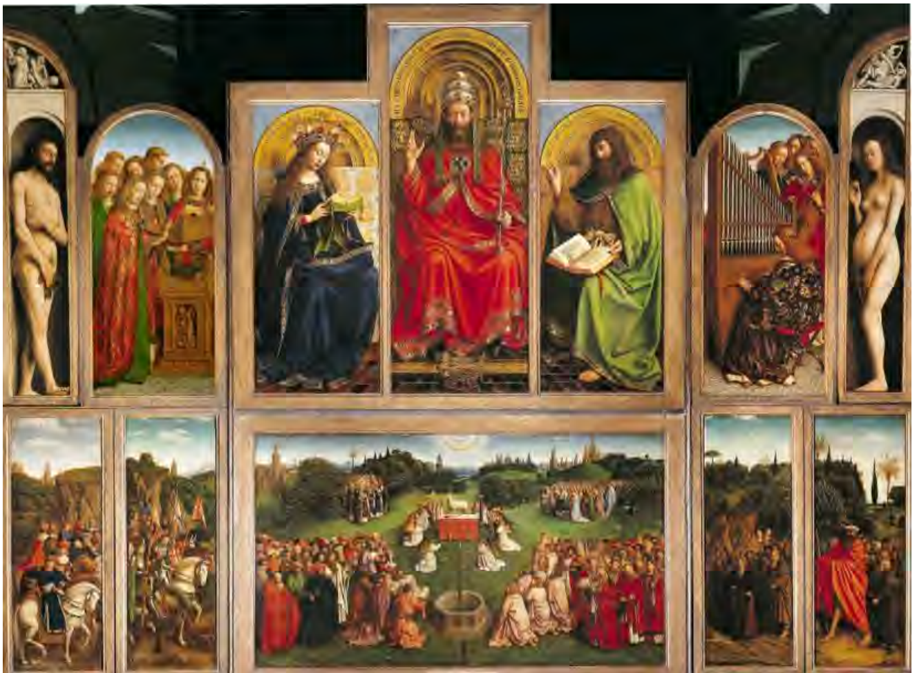
20. Polittico aperto

A destra, la Sibilla Cumana (fig. 19) pronuncia invece le parole che sant'Agostino (354-430 d.C.) nella Città di Dio (XVIII, 23) attribuisce alla Sibilla Eritrea, e che iniziano precisamente con la parola Rex : «Il re scende sui secoli futuri per regnare nella carne». A complicare le cose, la Sibilla Cumana ha sul petto la misteriosa parola MEIAPAROS, mai completamente chiarita dagli interpreti del polittico ma che potrebbe significare «Priameia Parthenos», «vergine figlia di Priamo», e alludere a un'altra profetessa, la troiana Cassandra. Tutte le veggenti qui convergono, e la storia geme – come nelle doglie del parto – attendendo che venga questo re dei secoli futuri.