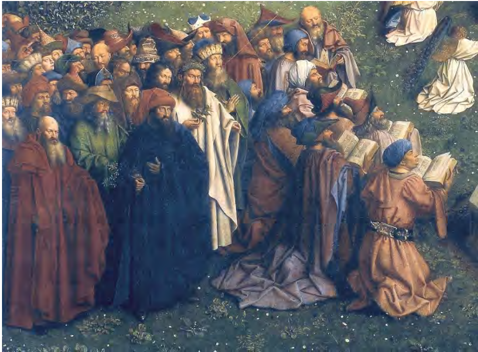
52. Gli Ebrei e i pagani

A sinistra in basso vediamo invece gli Ebrei, in ginocchio, e i pagani in piedi (fig. 52).