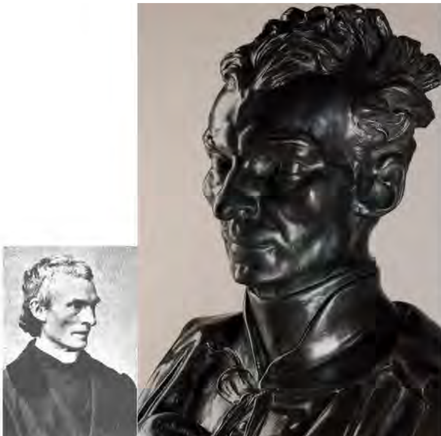
0a. San Pier Giuliano Eymard in fotografia e nel busto di Auguste Rodin (1840-1917)

Il Regno sociale di Nostro Signore Gesù Cristo è, nello stesso tempo, il suo Regno eucaristico. Prima di Benedetto XVI ad Ancona – dove volle ricordarlo l'11 settembre 2011, esattamente a dieci anni da quel terribile 11 settembre 2001 – lo ha messo a tema nel XIX secolo san Pier Giuliano Eymard (1811-1868), apostolo dell'adorazione eucaristica e fondatore dell'ordine religioso dei Sacramentini. San Pier Giuliano non intendeva il Regno eucaristico e sociale di Gesù come un tema meramente devozionale. Aveva elaborato le sue idee nel dialogo con una particolare scuola di pensiero cattolica, quella contro-rivoluzionaria, sorta agli inizi del secolo XIX sulla base di una critica sistematica delle correnti moderne che avevano portato alla Rivoluzione francese.