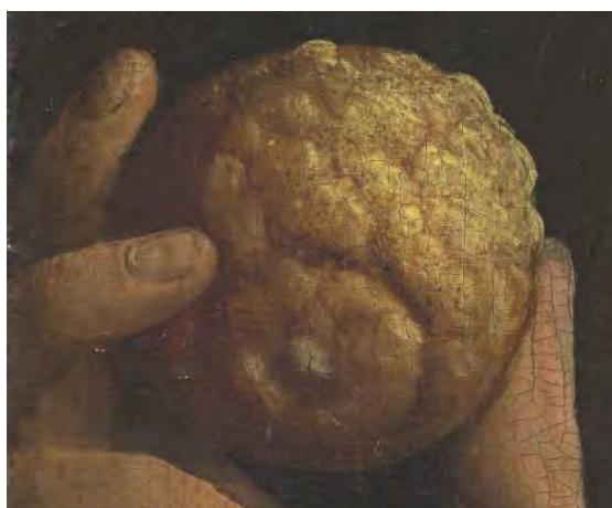
25. Ulteriore particolare