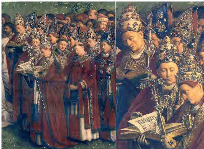
50. I Papi – 51. Particolare

L’onore di entrare nel gruppo degli apostoli, dove figura anche san Paolo, è riservato a un solo non contemporaneo di Gesù: san Tommaso d’Aquino (1225-1274), che appare come stupito di trovarsi in così eletta compagnia (fig. 49). Un Medioevo che sta finendo non trascura – riconoscendo il suo contributo unico alla mappatura del Regno di Gesù Cristo – di rendergli omaggio. Tra i Papi (fig. 50) emerge anche una difficoltà del tempo: sono ritratti tre pretendenti al ruolo di Papa nella complessa disputa degli inizi del Quattrocento (fig. 51). Ma i pittori sapevano che alla fine la Chiesa aveva superato le traversie – i tre sono ripresi senza che tra loro emergano conflitti –, riprendendo nella storia la sua testimonianza per il Regno.