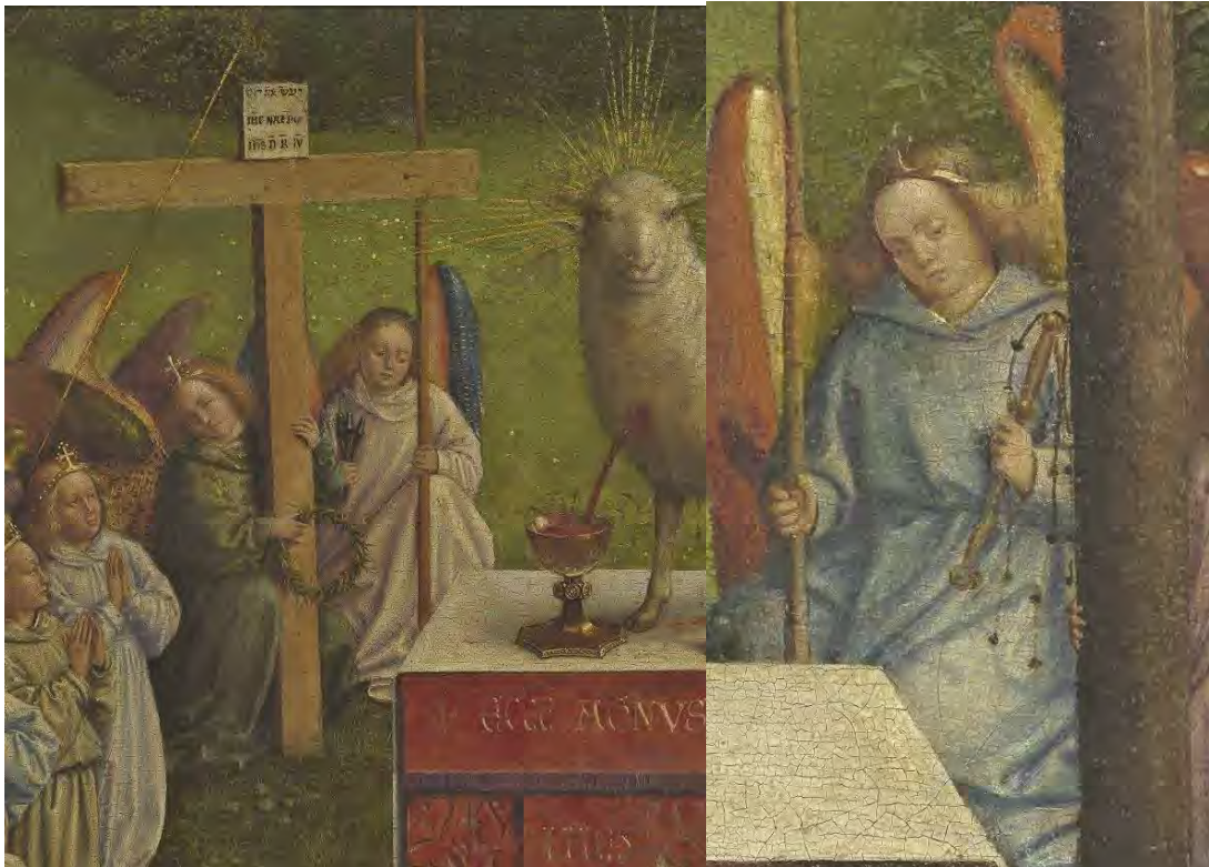
45-46. Gli strumenti della Passione

E richiede il memoriale della Passione, di cui altri angeli portano gli strumenti: la croce, i chiodi, la corona di spine (fig. 45) e il flagello (fig. 46).