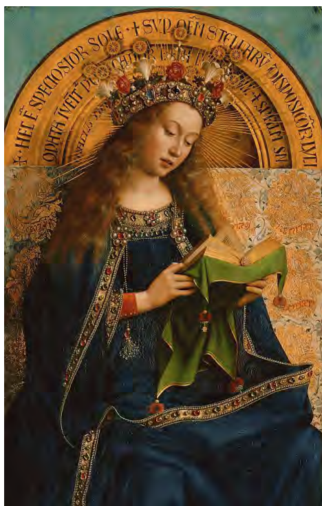
33. Maria Regina