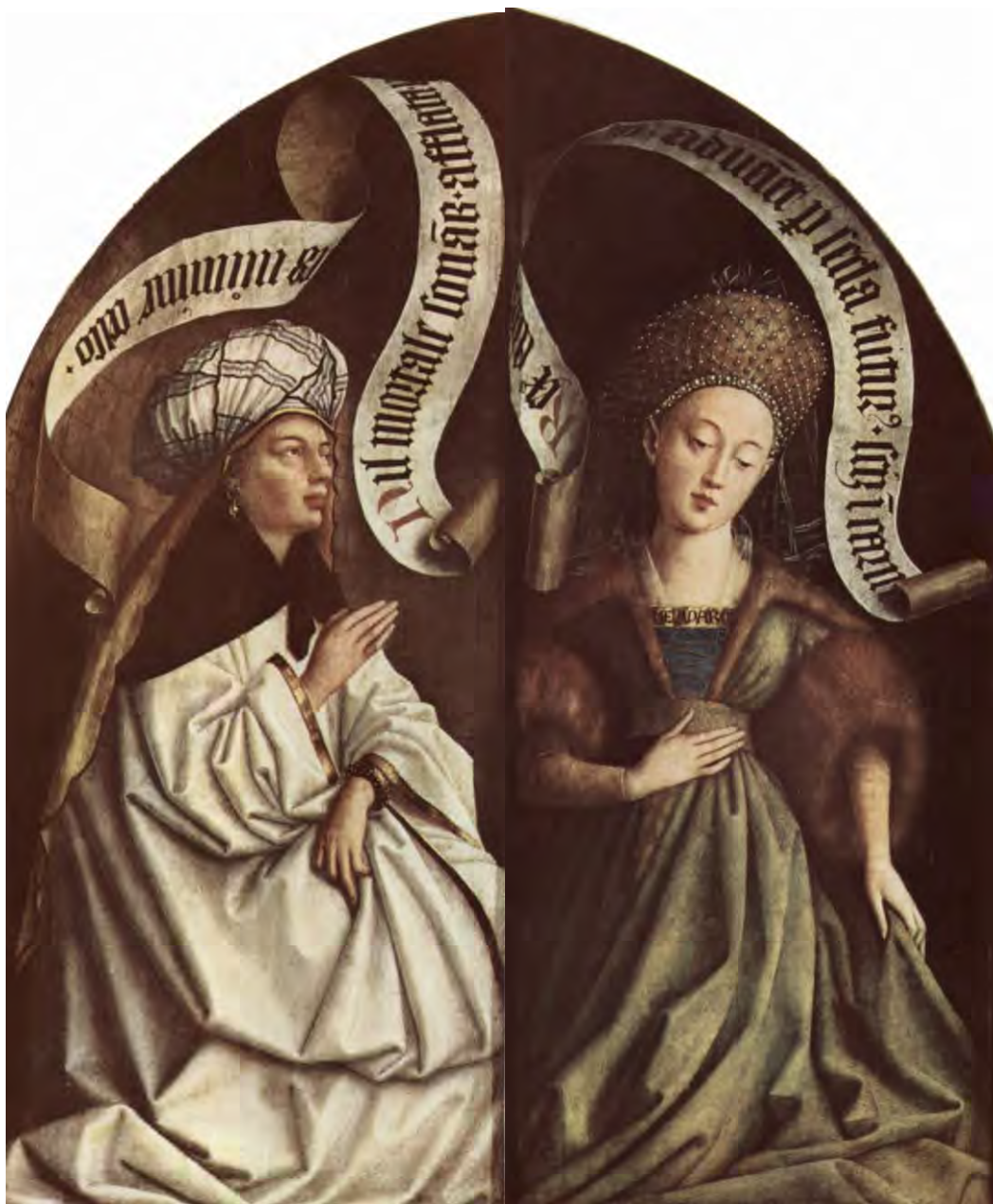
18. La Sibilla Eritrea – 19. La Sibilla Cumana

Il Regno di Gesù Cristo è universale. Nel polittico aperto vedremo che si estende anche ai pagani. Qui i Van Eyck ci ricordano che è stato preannunciato anche dai pagani. È stata loro imputata una certa confusione tra le Sibille, ma il senso ultimo è che tutto il mondo pagano aspettava oscuramente il Regno del Signore Gesù. A sinistra vediamo la Sibilla Eritrea (fig. 18), che non ha a che fare con l'Eritrea in Africa ma con la città anatolica di Eritre, nell'attuale Turchia. La banderuola riporta un brano dell' Eneide (VI, 50) di Virgilio (70-19 a.C.) che il poeta riferisce però alla Sibilla Cumana: «Nulla di mortale risuona nella tua voce quando su di te dall'alto soffia lo spirito». Ma vale per tutte le Sibille, che quando annunciano – per quanto in modo criptico e misterioso – l'avvento di Gesù sono davvero ispirate.