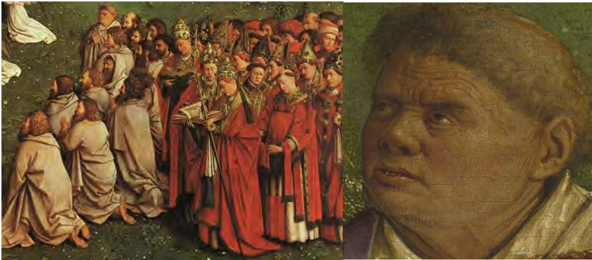
48. La Chiesa – 49. Particolare: San Tommaso d’Aquino

Questo Regno di Gesù Cristo è per tutti. È davvero cattolico, cioè universale. Lo mostrano i quattro gruppi di questo pannello. A destra in basso, gli apostoli e la Chiesa, guidata dai Papi (fig. 48).