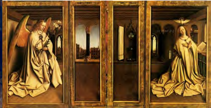
10 e 11. L'Annunciazione