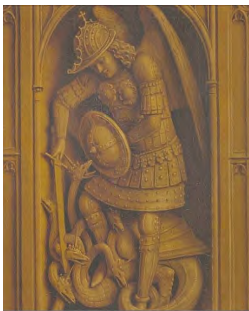
37. Ulteriore particolare

Il Regno di Gesù Cristo – è l'essenza stessa del politico a ricordarcelo – si estende anche alle arti, È un regno di bellezza; meglio: regna attraverso la bellezza. Gli angeli che cantano sulla sinistra (fig. 35) hanno una caratteristica singolare. L'arte per loro non è solo gioia: è sforzo, è fatica (fig. 36). Dobbiamo osservare con attenzione la parte bassa del leggio. Vi scopriamo (fig. 37) la lotta di san Giorgio con il drago. Il Regno di Gesù Cristo è venuto per distruggere il regno di Satana. La vittoria è certa, ma questo non rende meno dura la battaglia. Le forze dell'Inferno, ci è stato assicurato, non prevarranno. Ma questo non significa che non proveranno a prevalere per tutta la storia.