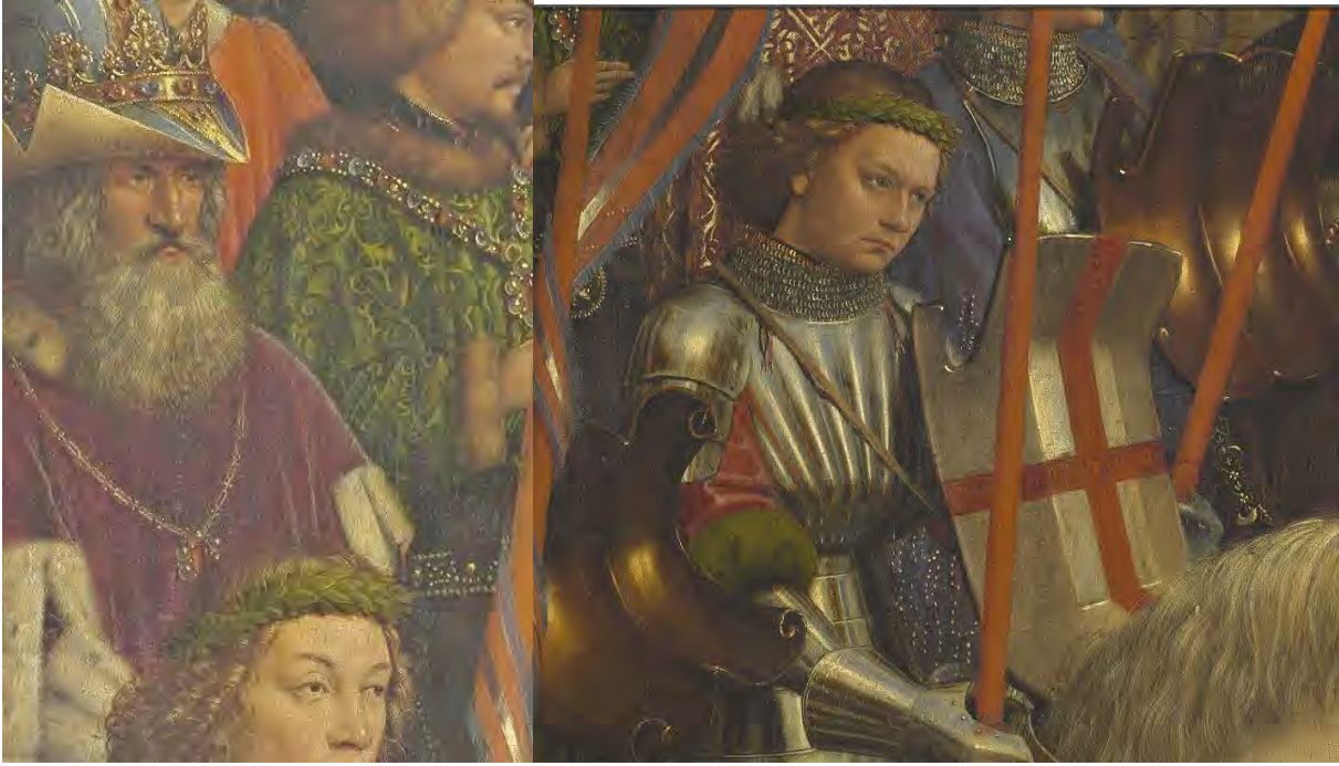
66. Carlo Magno – 67. Crociati

Da Carlo Magno (fig. 66) i cavalieri sono spesso nello stesso tempo governanti. L'omaggio alle crociate (fig. 67) si accompagna al ricordo di Carlo VII (1403-1451: fig. 68), che fu riconosciuto come legittimo re di Francia grazie a santa Giovanna d'Arco (1412-1431). Questa complessa cavalcata ci ricorda, con la massima eloquenza possibile, che il Regno eucaristico di Gesù Cristo è un regno sociale.