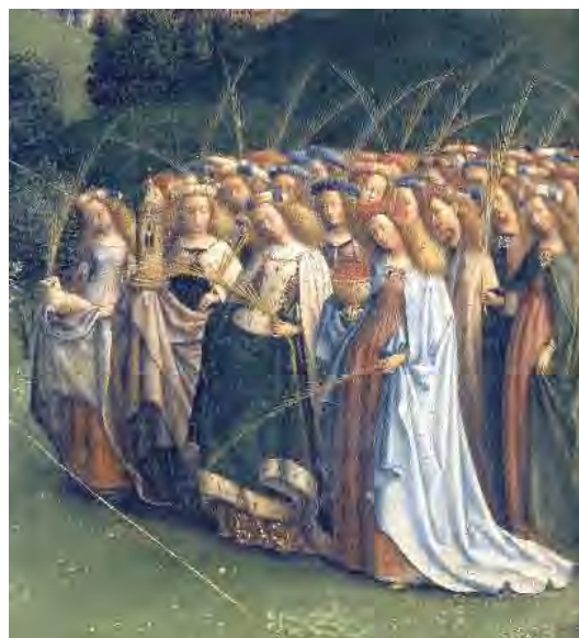
56. Le sante

A destra, le sante (fig. 56), anche qui tratte da tutte le condizioni femminili e guidate in prima fila (fig. 57) da sant'Agnese (291-304) – con un ennesimo agnello –, santa Barbara (273-306), raffigurata con la torre in cui fu rinchiusa dal padre per sottrarla ai pretendenti, santa Caterina d'Alessandria (287-305) e santa Dorotea (?-311), con il cesto di mele che un angelo portò, convertendolo, al pagano Teofilo il quale, incontrato dalla santa che andava al martirio, le aveva ironicamente chiesto di mandargli qualche frutto dal giardino del suo sposo.