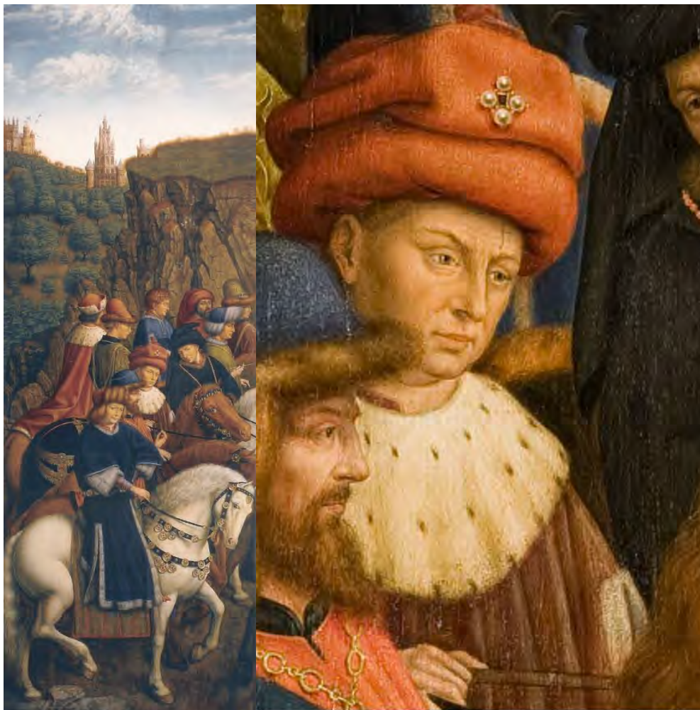
62. I giudici. - 63. Particolare

Dal punto di vista concettuale, il pannello è tutt'altro che irrilevante. Afferma e precisa che il Regno sociale ed eucaristico di Gesù Cristo si estende alla politica. I «giudici» sono infatti gli uomini politici, gli amministratori delle città che si vedono sullo sfondo (fig. 62). Fra questi c'è un personaggio con un'aria da borghese o da mercante che, al paragone con autoritratti di Jan Van Eyck, lascia pochi dubbi: qui il pittore ha raffigurato se stesso (fig. 63). Si sente parte del Regno, non il mero esecutore di una commessa commerciale. Fa parte dell'ironia della storia che questa piccola vanità, l'autoritratto, gli sia stata in qualche modo sottratta, e oggi al posto del suo pannello ci sia un falso.