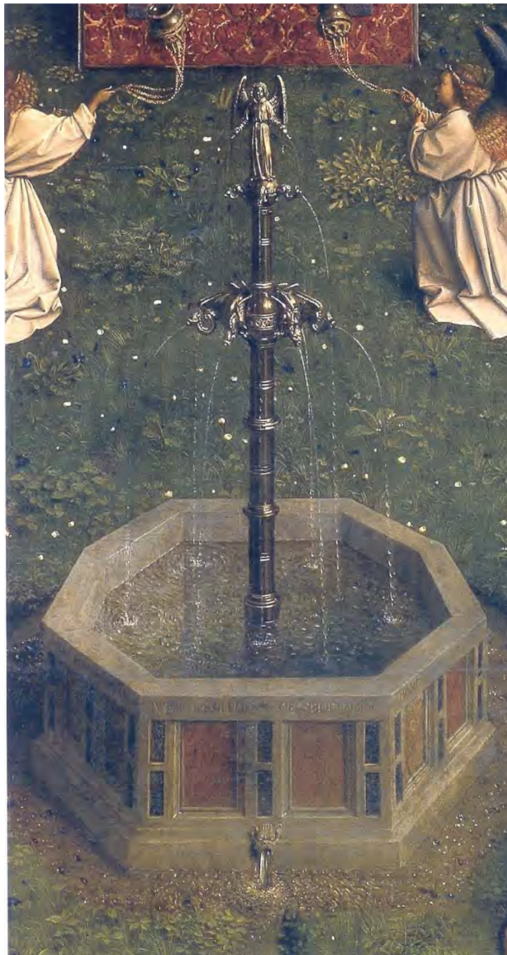
47. La Fontana della Vita

All'altare dell'Agnello fa da contrappunto l'immagine molto medievale – e carissima al Quattrocento – della Fontana della Vita (fig. 47), che ha otto lati corrispondenti alle otto beatitudini e da cui sgorga l'acqua viva del Signore che alimenta e sostiene tutto il Regno. Senza quest'acqua, che irriga tutta la Gerusalemme Celeste e tutta la Gerusalemme terrestre, non ci sarebbe il Regno, e ogni cosa resterebbe secca e sterile. In basso, l'acqua viene a noi e c'invita ad attingerne, a bere, a diventare anche noi parte del Regno.