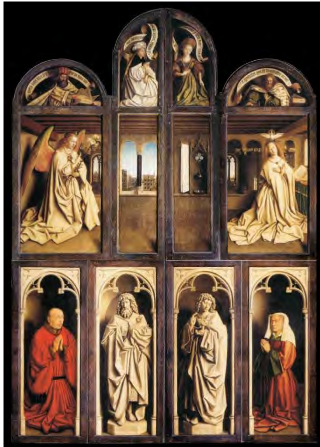
2. Polittico chiuso