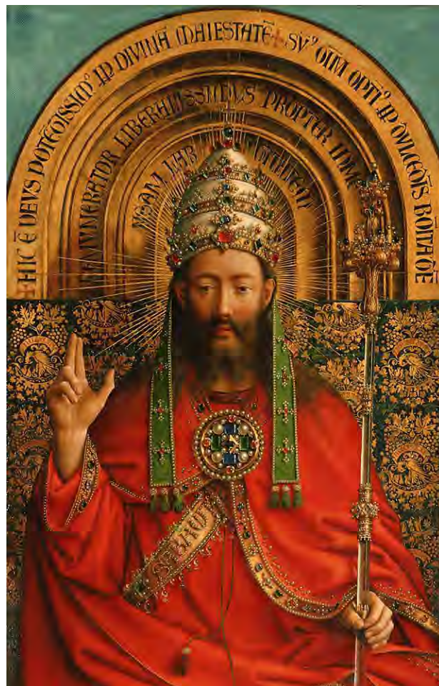
28. Cristo Re