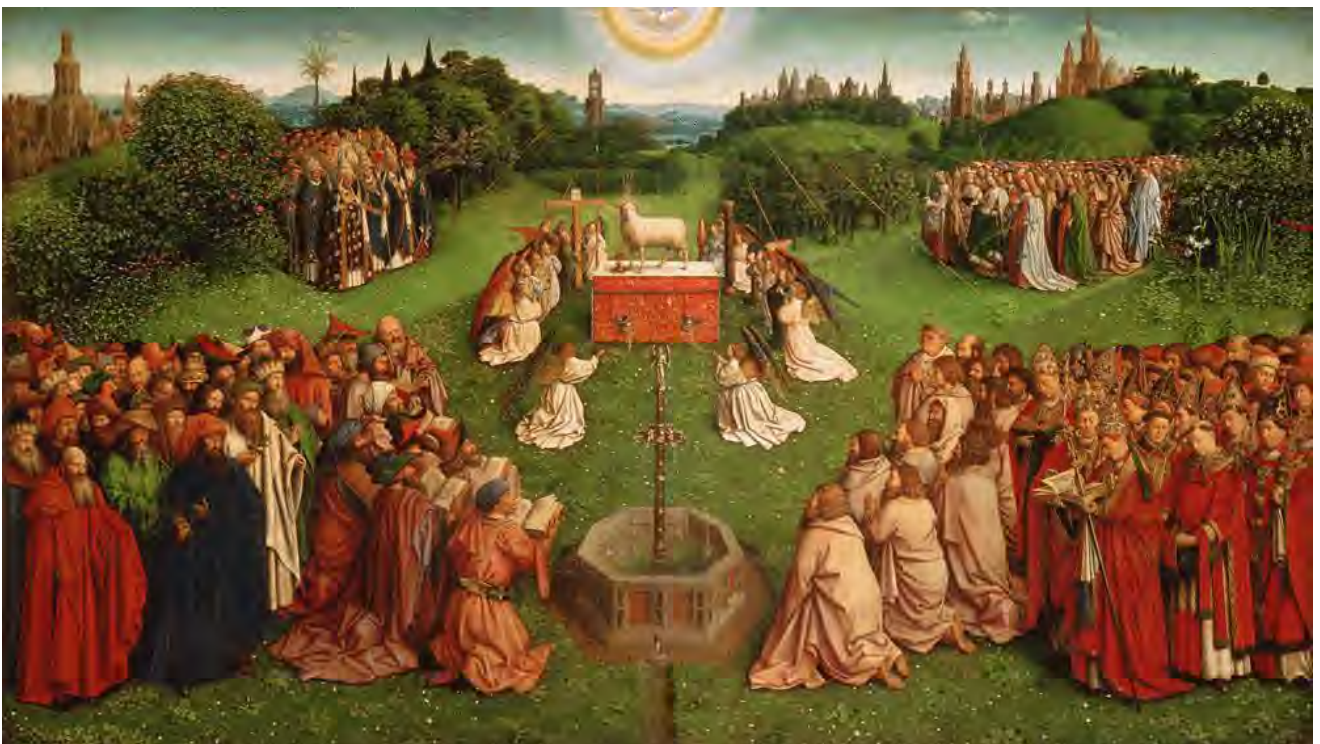
39. L'Adorazione dell'Agnello Mistico

A sinistra gli angeli cantano, a destra suonano (fig. 38). Qui i Van Eyck hanno voluto sottolineare meno lo sforzo e la fatica, e far trionfare la bellezza e l'armonia. Una cetra e un'arpa restano in riposo: regna l'organo (fig. 38a), quasi a preannunciare la musica barocca.