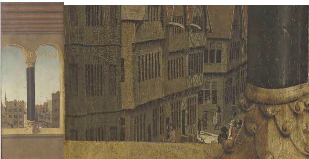
12. Paesaggio fiammingo – 13. Particolare

Alla regalità di Gesù fa da necessario complemento la regalità di Maria, che si affermerà nel politico aperto ma già qui trova la sua preparazione. Maria (fig. 10), su cui scende lo Spirito Santo e che si appresta a una vita dove mediterà molte cose nel suo cuore – simboleggiata dai libri –, porta al collo un gioiello principesco, uno zaffiro.