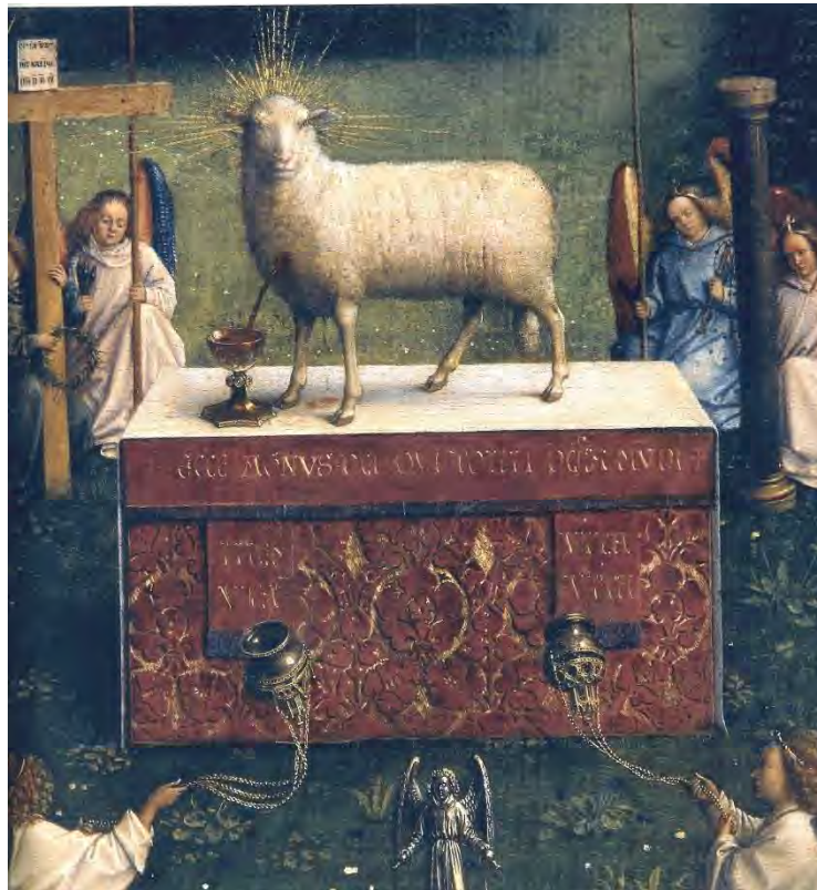
41. L'Agnello sull'altare

Vi si compie il sacrificio eucaristico (fig. 42): dal costato dell'Agnello sgorga il Sangue di Cristo nel calice (fig. 43).