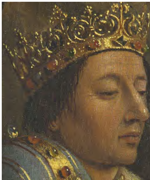
68. Carlo VII

Da Carlo Magno (fig. 66) i cavalieri sono spesso nello stesso tempo governanti. L'omaggio alle crociate (fig. 67) si accompagna al ricordo di Carlo VII (1403-1451: fig. 68), che fu riconosciuto come legittimo re di Francia grazie a santa Giovanna d'Arco (1412-1431). Questa complessa cavalcata ci ricorda, con la massima eloquenza possibile, che il Regno eucaristico di Gesù Cristo è un regno sociale.