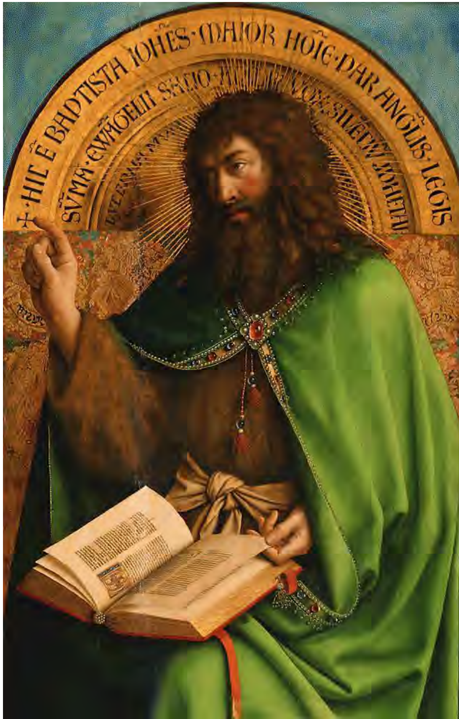
34. San Giovanni Battista