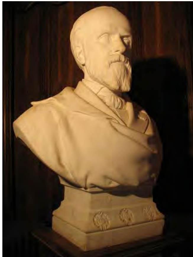
0b. Busto di Blanc de Saint-Bonnet

1821), di cui ribadisce e fa conoscere le tesi sull'infallibilità pontificia, Blanc de Saint-Bonnet prepara, con un'articolata critica delle ingiustizie della Rivoluzione industriale, la generazione successiva di contro-rivoluzionari come René de La Tour du Pin (1834-1924), che metteranno al centro delle loro preoccupazioni i problemi socio-economici. Sulla scia di de Maistre, Blanc de Saint-Bonnet riflette anche sulla Rivoluzione francese e sulla storia, mostrando il nesso fra tre Rivoluzioni che, procedendo l'una dall'altra, costituiscono un'unica Rivoluzione: quella protestante, quella illuminista e quella socialista.