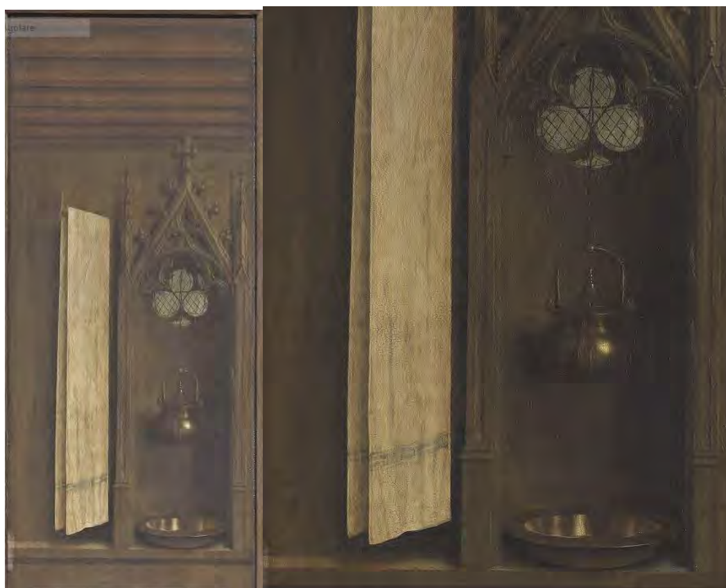
14 e 15. Interno fiammingo

Tra l'angelo e Maria (fig. 11) c'è uno spazio che sembra vuoto, una «zona acustica» come l'ha chiamata il filosofo Fabrice Hadjadj ( L'Agneau Mystique. Le retable des frères Van Eyck , Éditions de L'Œuvre, Parigi 2008, p. 24), dove risuonano le parole del nuovo Regno. Ma questo spazio sembra semplicemente vuoto. Non lo è. È il mondo, dove sta per instaurarsi il Regno di Gesù Cristo. Ingrandendo, la veduta dalla finestra (fig. 12) si rivela la vita brulicante di personaggi della città (fig. 13). Jan van Eyck ha raffigurato qui quanto vedeva effettivamente dalla sua finestra sul Korte Dagsteeg a Gand. La regalità di Cristo non è astratta: è concreta. Si esercita sul mondo com'è: proprio quello che vediamo dalla finestra, non importa se a Gand o altrove.