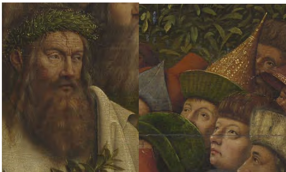
53. Virgilio – 54. Un pagano

Gli Ebrei si prostrano attendendo il Regno. I pagani restano in piedi, ma anche loro convergono verso il centro del pannello, verso l'Agnello. Alla citazione dell' Eneide nel polittico chiuso fa da pendant qui il ritratto di Virgilio (fig. 53), in un insieme eterogeneo che comprende musulmani e perfino cinesi (fig. 54). I commenti che fanno riferimento al dialogo interreligioso sono interessanti ma forse anacronistici. I Van Eyck vogliono sottolineare ancora una volta la dimensione universale del Regno eucaristico.