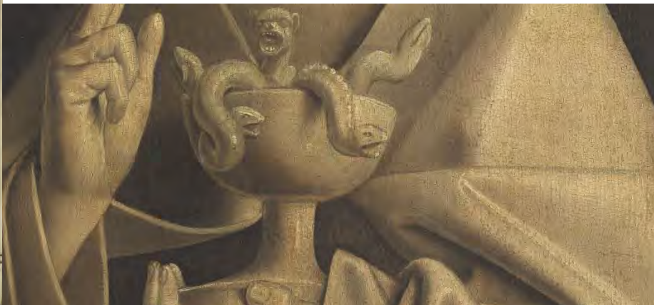
6. San Giovanni Evangelista – 7. Particolare