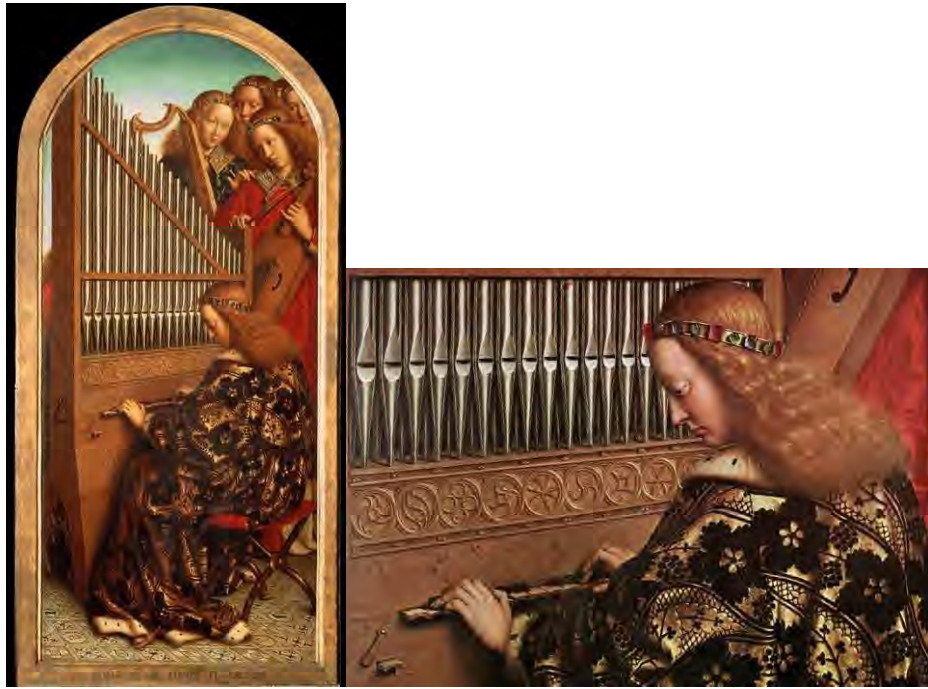
38. Gli angeli musicanti – 38a. Particolare