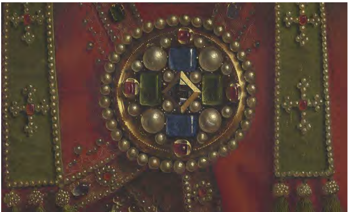
32. Ulteriore particolare