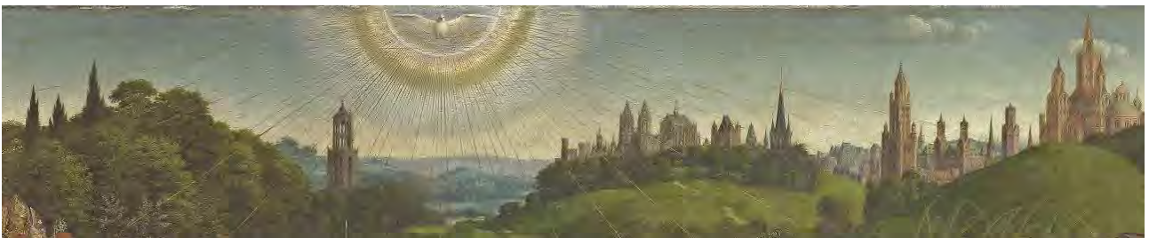
58. Lo Spirito Santo

Dietro ai santi e alle sante, emerge una parte del pannello di cui sbaglieremmo a trascurare l'importanza: i raggi dello Spirito Santo trasfigurano la Terra e la trasformano, propriamente, nel Regno (fig. 58).